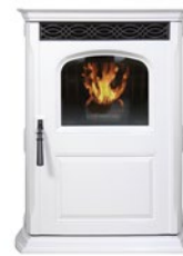
gris clair frost